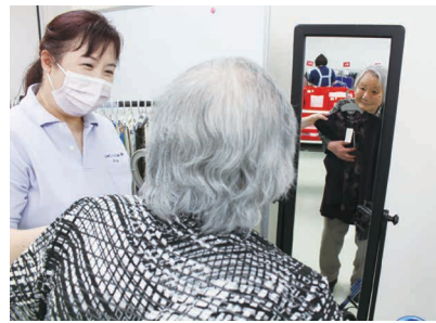
この服どうかしら？