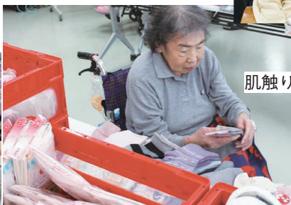
肌触りがいいねえ。