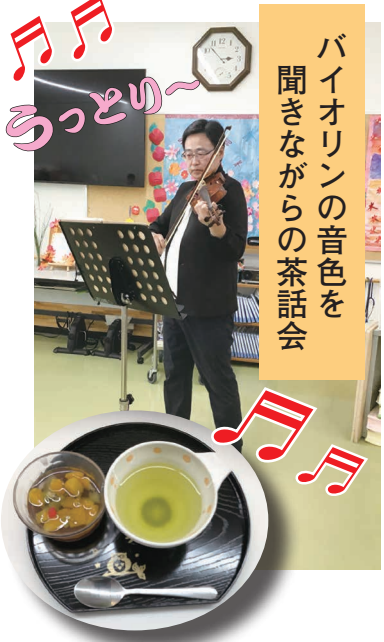
デザートフルーツ水ようかん で ホットひと息。

感染予防対策のため、余興出演時のみはマスクを外しましたが、 十分な距離をとり、それ以外のご利用者様、職員にもマスク着用を徹底し、十分に注意しながら行ないました。