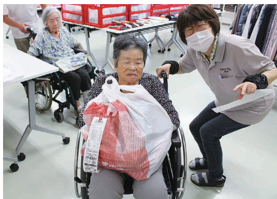
いっぱい買いました。戸