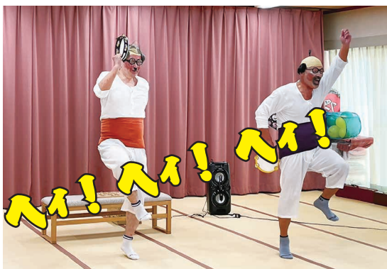
おっさんふたりの 和風 ダンシングヒーロー