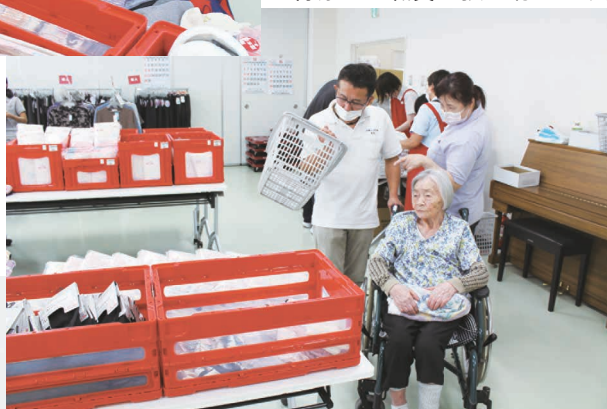
付添いの職員も張り切ります。