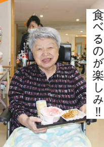
かき氷を食べるのが楽しみ!!