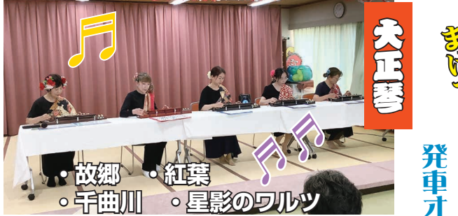
懐かしの曲であの頃を思い出します。