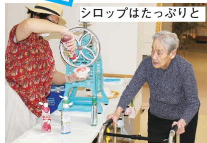
シロップはたっぷり