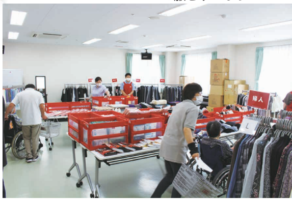
会場いっぱいたくさんの洋服が並びました。

ご利用者の皆様がいり物を楽しまれたのと同時に、個人の持ち物が特定できるよう、ひとつひとつの品に名前つけが必要になります。