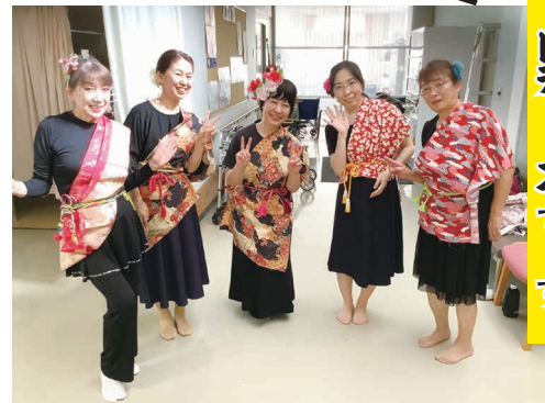
室賀大正琴 レディースです

室賀デイサービスセンターでは、9月9日(月)～9月14日(土)の一週間毎日、敬老会の余興として職員が一丸となって演舞や仮装、合奏などを披露しました。ご利用者様からは「毎年、楽しみにしています」「嬉し涙が止まらない」「ここだけで終わるのもったいないね」などのお声をいただきました。(関連記事は6ページに)