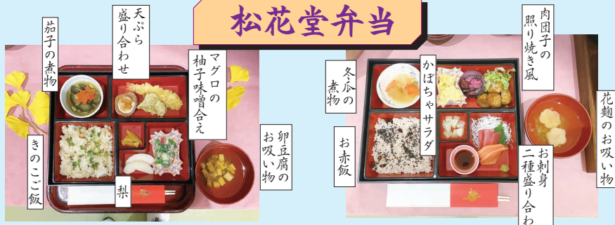
見た目、おいしさ、ボリューム大変喜ばれました。