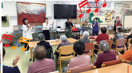
一緒にコラボして 故郷を利用者さんと手話で楽しみました。