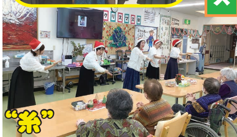
利用者さんとの絆を手話で表現しました。