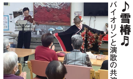
♪雪椿月 バイオリンと演歌の共演