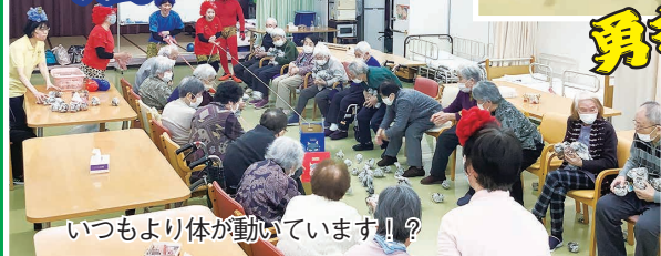
いつもより体が動いています!!?