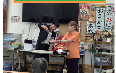
新聞紙に水を入れて..... あれ?水がもれません。どこに?